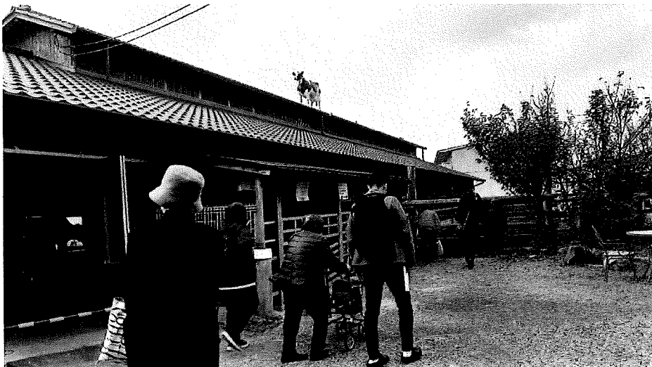
←屋根の上に牛のモニュメントがある木造牛舎の見学