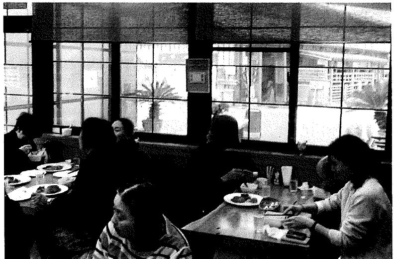
牧場併設の『レストランいちづ』にて 洋食ランチを楽しむ様子→